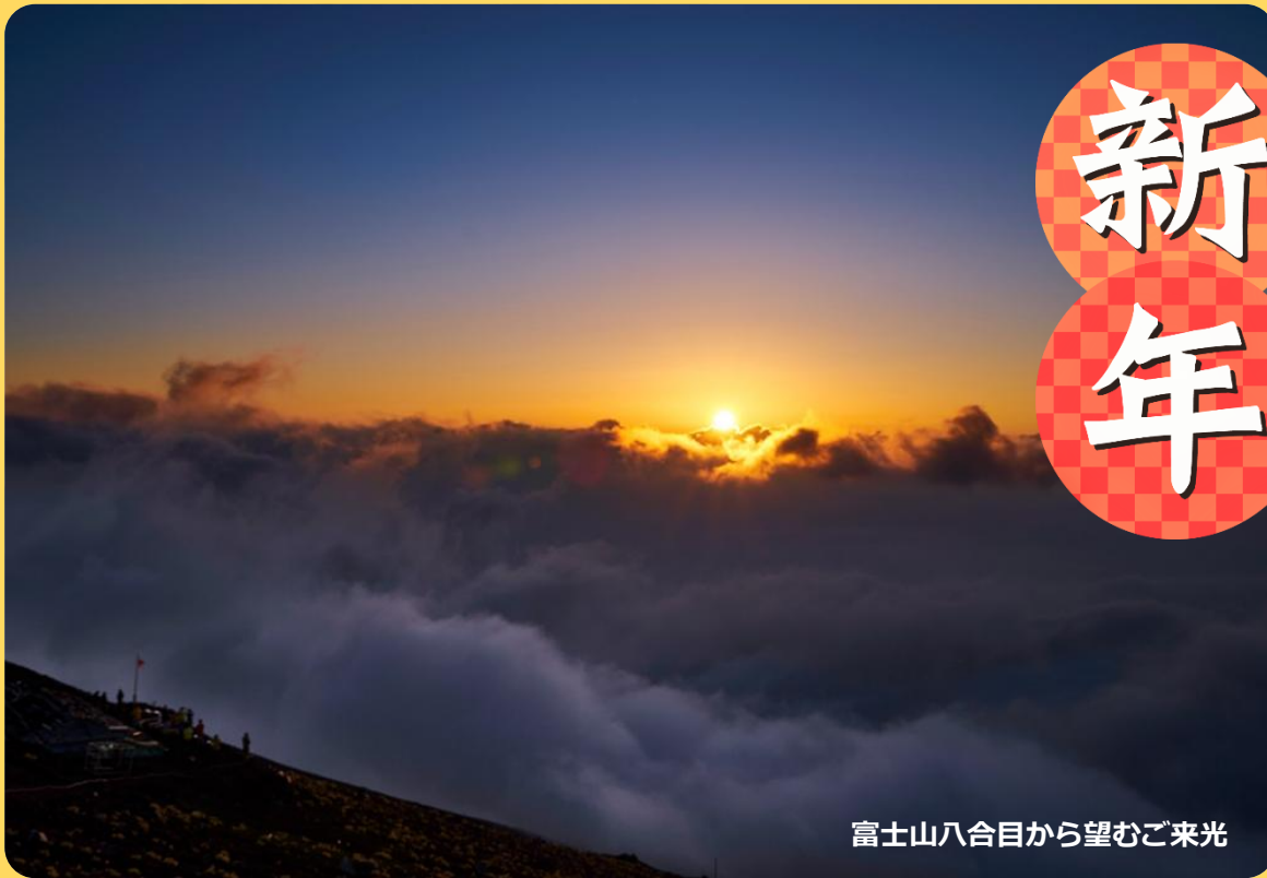
富士山八合目から望むご来光

介護老人保健施設 足立老人ケアセンター 足立区保木間5-23-20 電話 03-5686-3965