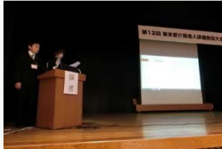
口演発表として参加（介護科、石川副主任）