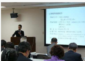
東京都シンポジスト（運営管理室 河原課長）

「介護医療の同時改正を見据えて～地域包括ケアと介護報酬～」をテーマに東京都代表として足立老人ケアセンターが参加、当施設の取り組みについて発表させていただきました。