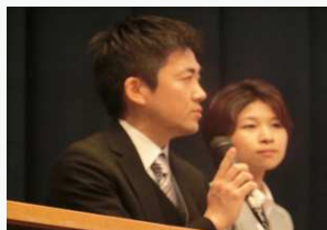
シンポジスト参加（リハビリ科、丹氏）

また当施設スタッフが永年勤続者表彰者の代表として謝辞を述べさせていただきました。