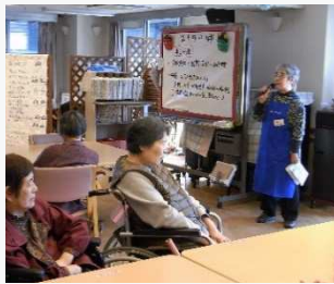
新プログラム 「お話の会」を始めました

ケアセンターではボランティアさんを募集しています。下記のような活動の他、特技や経験を生かした内容や季節の行事のお手伝いなど、様々な活動が可能です。