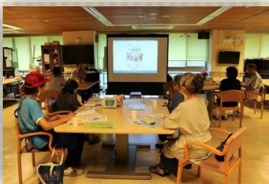
第1回「介護保険について」

介護保険の仕組みや介護サービスの利用方法、介護老人保健施設の役割などを紹介しました。