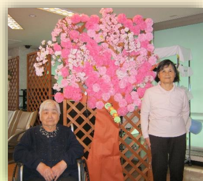
入所フロアでは手工芸で作成した桜の木が満開になりました！

足立老人ケアセンターは平成8年3月11日に開設され、今年で24周年を迎えました。3月7日（土）に創立祭が予定されていましたが、新型コロナウイルス感染対策として規模を縮小して実施いたしました。出演を予定していたボランティアの皆様、当日を楽しみにされていたご利用者の皆様にはご迷惑をお掛けしたことをお詫び申し上げます。来年は25周年となりますので、改めて職員一同で盛り上げていきたいと思っております。