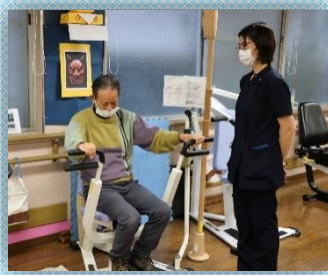
デイケアの筋トレ機器の紹介