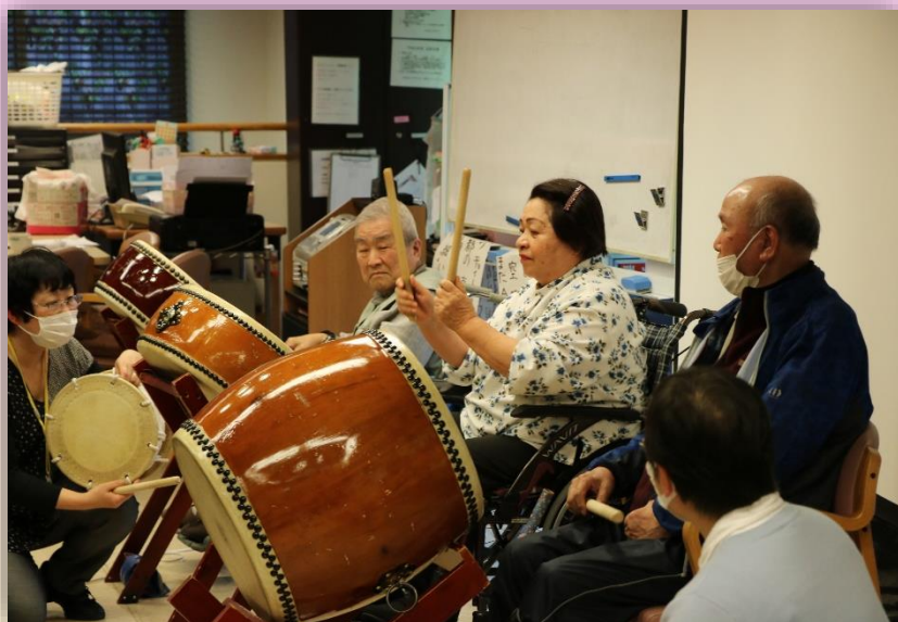
デイケアでは、この日の為に練習を重ねた太鼓サークルの皆様の演奏が披露されました