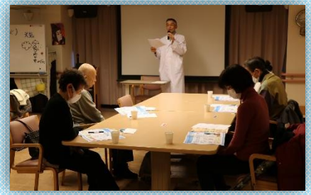
専門医のお話に皆さん興味津々です

勉強会の前半では副施設長より、用語の解説やロコモ予防の注意点などを分かりやすくお話しして頂きました。また後半はリハビリ室に会場を移動して、リハビリ職員による体力測定やロコモ予防の体操の紹介、デイケアで導入している筋トレ機器の紹介などを行ないました。正しい運動習慣を身に付けて、いつまでも健康に歩ける体力を保ちましょう。