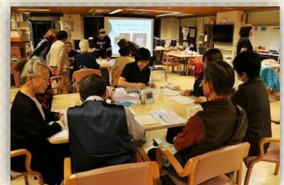
第3回「学習療法について」

認知症の原因や症状と、認知症予防に役立つ学習療法の紹介・学習体験を行ないました。