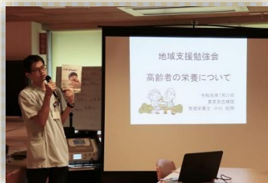
第2回「高齢者の栄養について」

高齢者の心身の変化や、必要となる食事や栄養のポイントなどをお話しました。また栄養補助食品の試食なども行いました。